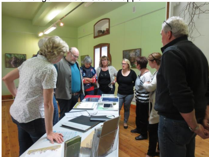
12 ganz verschiedene Mappen standen als Anregung zur Verfügung