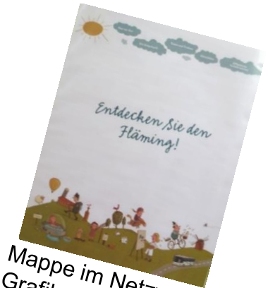
Mappe im Netzwerklayout Grafikerin: Stefanie Jeschke