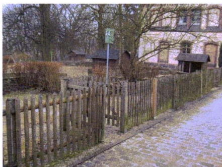
Blick von der Straße