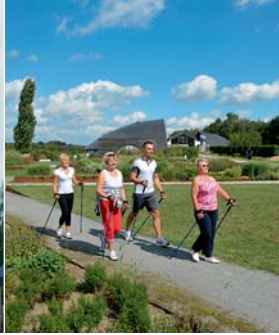
SteinTherme Bad Belzig