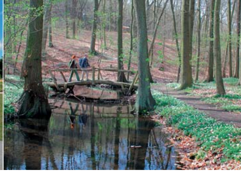
Wandern im Paradies