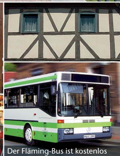
Der Fläming-Bus ist kostenlos