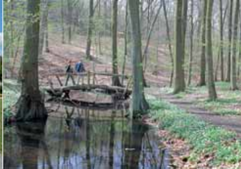
Wandern im Dippmannsdorfer Paradies