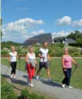
SteinTherme Bad Belzig