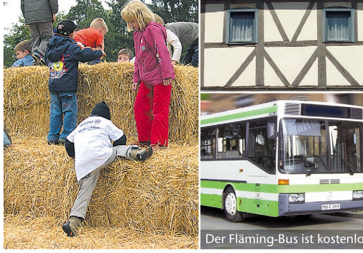
Der Fläming-Bus ist kostenlos