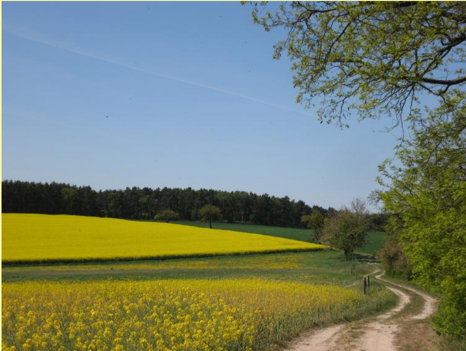
Naturpark Hoher Fläming