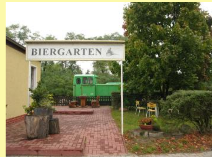
Biergarten in Görzke