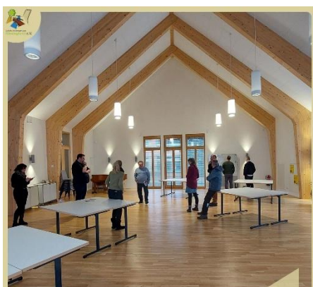
Vorstandssitzung im Kirchenkreiszentrum Lehnin

Der Kirchenkreis Mittelmark-Brandenburg (EKMB) ist die Gemeinschaft der meisten evangelischen Kirchengemeinden in der LEADER-Region Fläming-Havel. Seine Dienststellen waren bisher in mehreren Gebäuden verteilt. Für größere Veranstaltungen mussten stets Räumlichkeiten angemietet werden, die nicht immer die optimalen Bedingungen hatten.